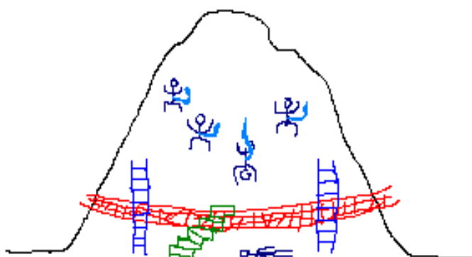
Диаграмма 1С. Инструменты Социальной Политики