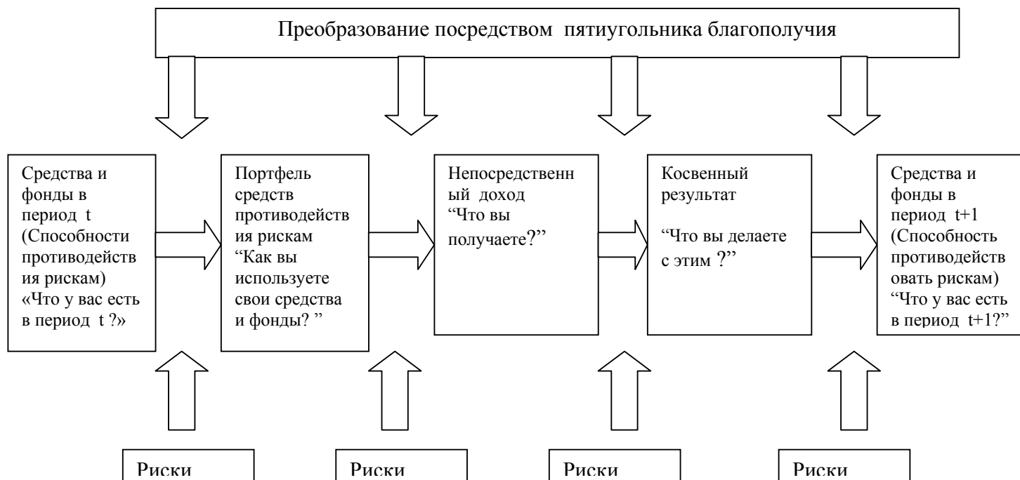
Таблица 1А: Теоретическая структура по способностям противодействия рискам и подверженности рискам

налогов или передачи в другие хозяйства.